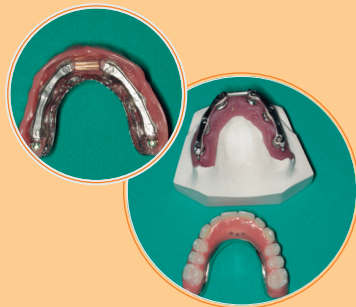
PROTESIS COMPLETA ACRILICA SOBRE IMPLANTES Y ESTRUCTURA BARRA.