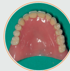
PROVISIONALES ACRÍLICA REMOVIBLE