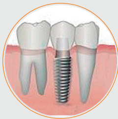
DIENTE CON 1 IMPLANTE UNITARIO