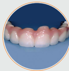
PRÓTESIS COMPLETA FIJA METAL CAD-CAM Y PORCELANA SOBRE 6 IMPLANTES