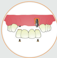
4 DIENTES CON SOLO 2 IMPLANTES