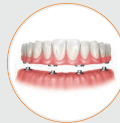
PRÓTESIS COMPLETA FIJA CON METAL COLADO Y ACRÍLICO. 6 IMPLANTES PROTESIS ECONÓMICA